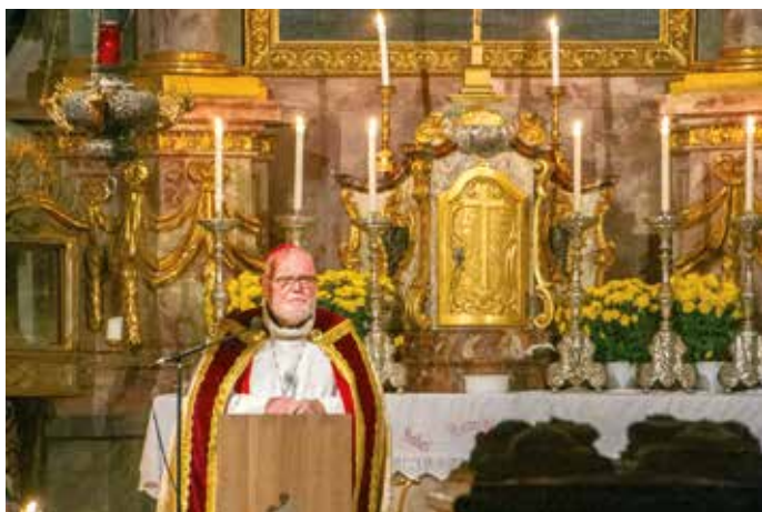
Erzbischof Kardinal Reinhard Marx bei unserem Patrozinium